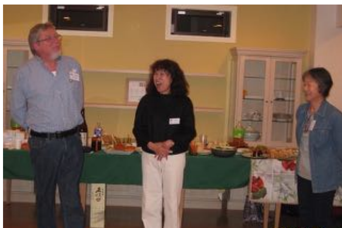
マッチングセレモニーELE HOUSEでのED

竣工したてのELEハウスにて催されたマッチングは、英国調？イタリア調？ともあれ素敵なキッチンで偉大なる主婦力全開!! 軽食のつもりが、おもてなしの料理がずら〜りと並べられました。可愛い季節の和菓子も好評でした。吟醸日本酒で乾杯。「先ずは顔合わせ」の企画でしたが、すっかり寛いで和やかな関係になりました。大成功ですよね。受入れの始まりに恒例化しても良い、と思った次第です。