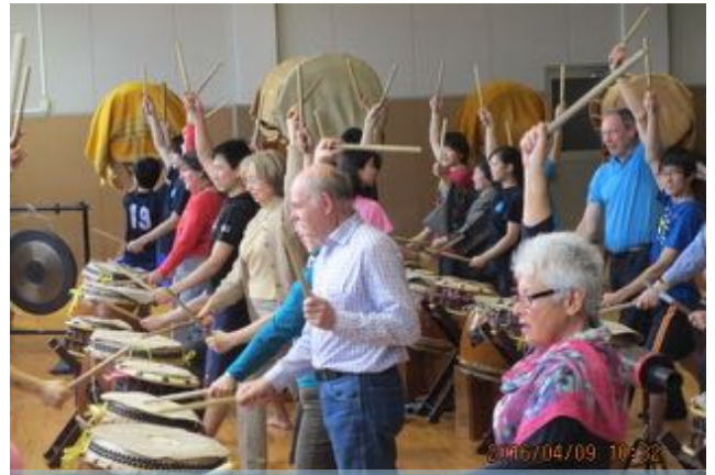
深沢高校での和太鼓

九日土曜日は、十時集合で和太鼓の部活が盛んな都立深沢高校を訪問、見学しました。十一人のアンバサダーは見学というよりは実習を沢山させて貰い、大いに楽しんだようです。一人置きに部員の高校生が付き添って身振りでお手本を見せてくれ、真ん中で先生が拍子を取りました。アンバサダーの希望でクラブとして初めて実現した和太鼓の見学でしたが、皆さん頬を染めて楽しげに太鼓を打っていました。高校生達の熱気も伝わってきて、若さを眩しく感じた半日でした。