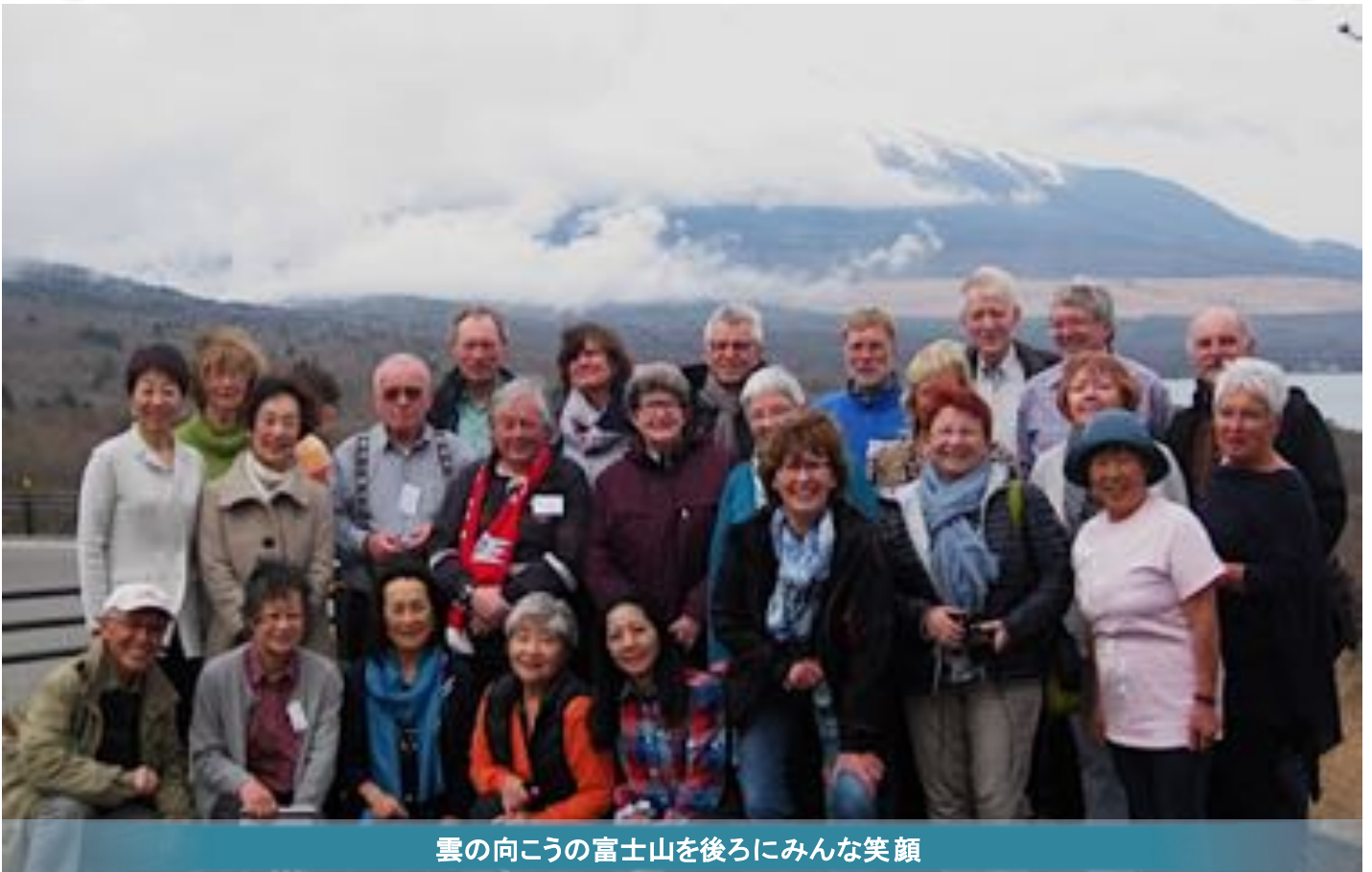
雲の向こうの富士山を後ろにみんな笑顔