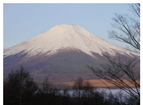
朝、ホテルの窓から見えた富士山

「桜と富士山」のキャッチフレーズで始まったドイツ・ハノーファーの受け入れでした、EDである私と同様、すべてが繊細で、桜の開花時期も、河口湖の天気も神頼みでした。出発当日の雨が嘘のように、翌日晴れ渡り、雪化粧した“美富士”をホテルの窓から見たとき、拍手喝采し、抱き合いました。アンバサダーの方たちは早朝の5：00頃から起きて眺め写真に記憶を残したとか。大成功！！19人のアンバサダー（カップル5組、男性3人、女性6人）を2016年4月5～12日までホストの方（12家庭）にお願いし、快く引き受けていただきました。各係りの担当の方、ディホスト、ダイナーホストの方たちの気持ち良いご協力のもとに1週間はあっという間に過ぎました。会員の笑顔とおもてなし、私たちが楽しんでいる姿を見て、ドイツの方たちも喜んでくれたと確信しています。